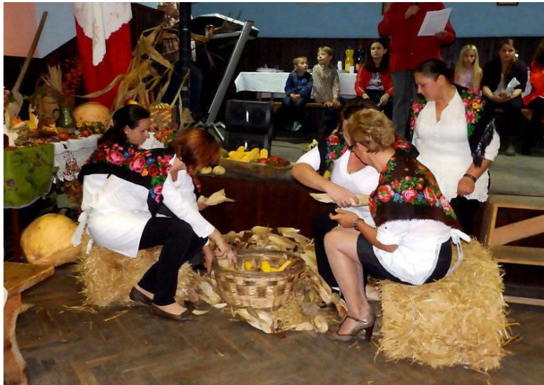
Slika 2. Lužđana u Donjim Mostima

U registru udruga Republike Hrvatske upisane su 32 udruge s područja općine Kapela iz sporta, kulture, zdravstva.