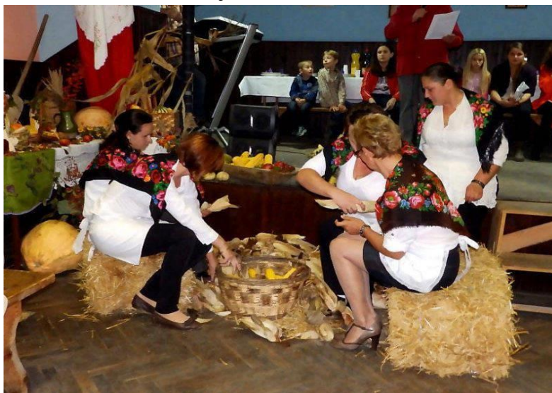
Slika 2. Luždana u Donjim Mostima

U registru udruga Republike Hrvatske upisane su 34 aktivne udruge sa sjedištem u općini Kapela iz područja sporta, kulture, zdravstva, lovstva, vatrogastva.